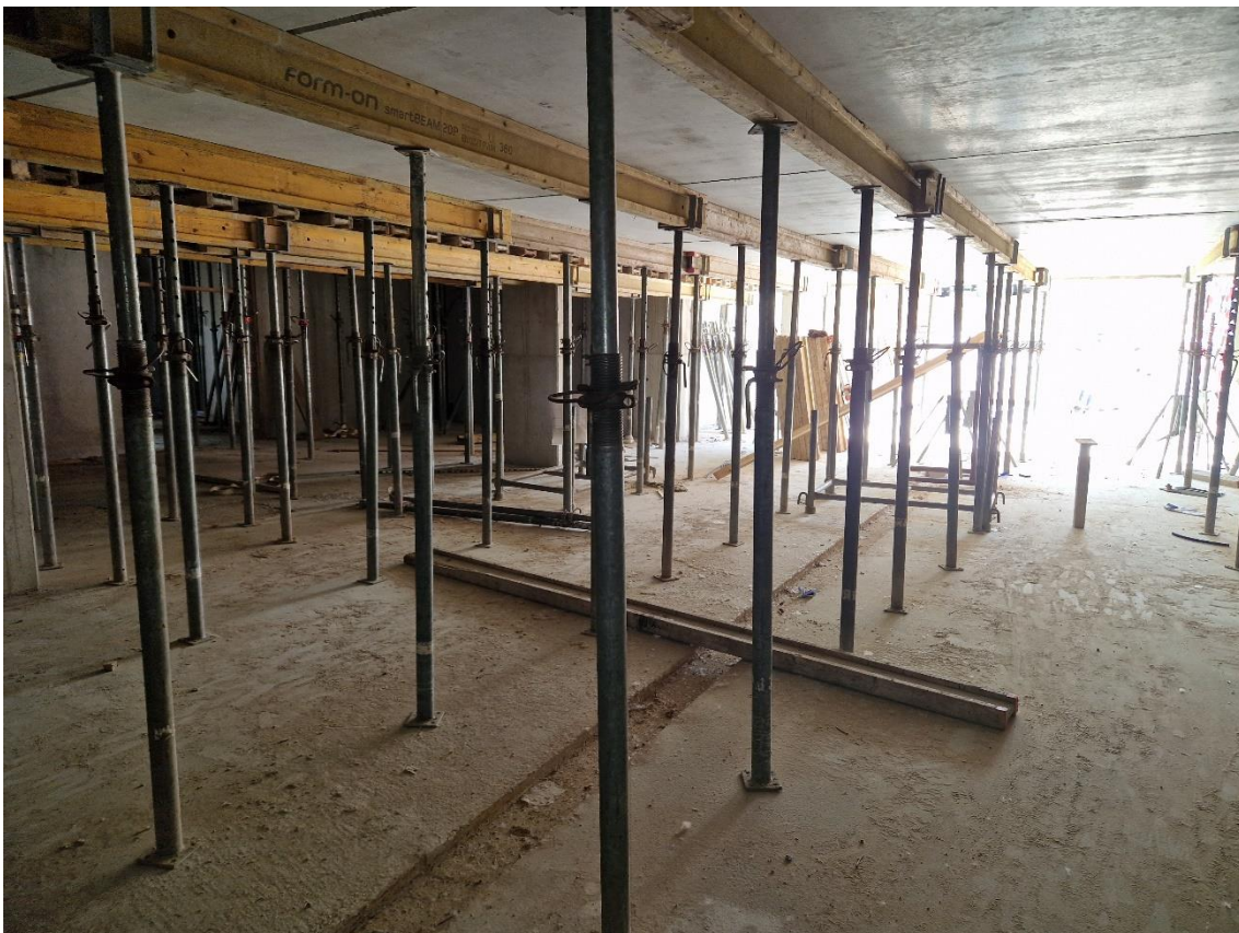
Abbildung 2: Foto Tiefgarage Haus Süd (Aufgenommen am 15.06.2023)