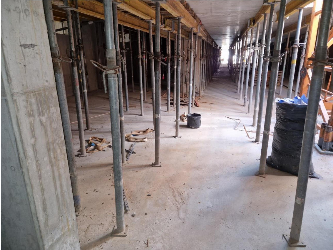
Abbildung 1: Foto Tiefgarage Haus Süd (Aufgenommen am 15.06.2023)