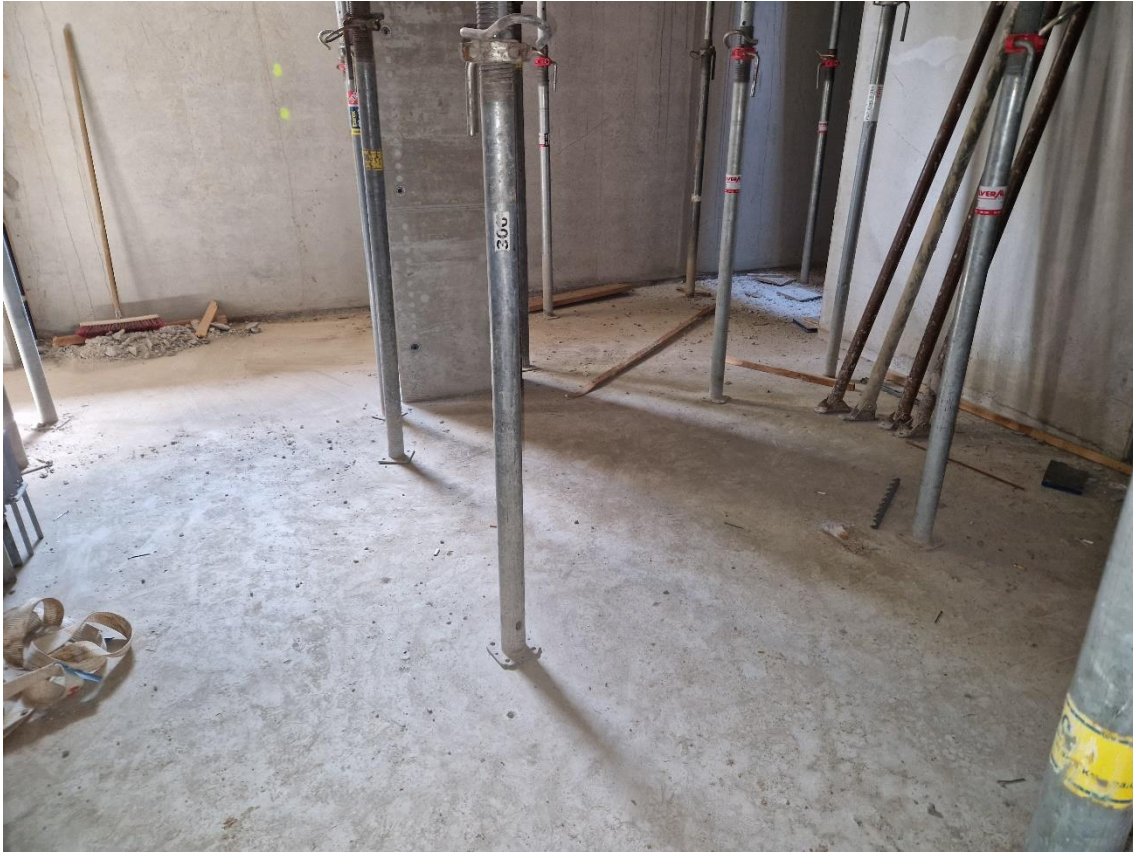
Abbildung 3: Foto Keller Haus Süd (Aufgenommen am 15.06.2023)