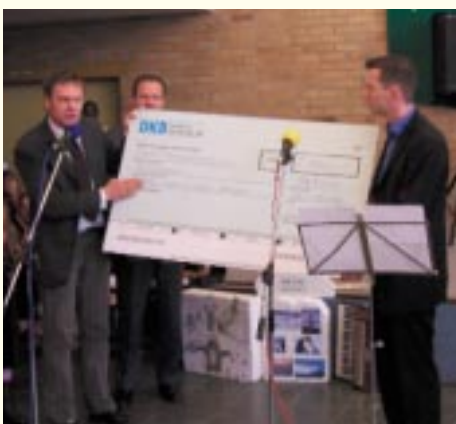
Scheckübergabe in der Carl-von-Linné-Schule

In der Carl-von-Linné-Schule in der Lichtenberger Paul-Junius-Straße wohnen und