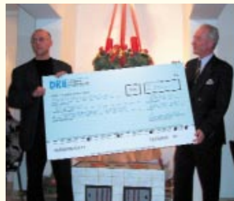
Scheckübergabe im Wohnprojekt „Undine“

Das Wohnprojekt „Undine“ in der Lichtenberger Hagenstraße ist kein Heim und es ist auch keine der üblichen Obdachlosenpensionen. In diesem Haus, mitten im Alt-Lichtenberger Kiez, wohnen rund 40 Frauen und Männer, die von Woh-