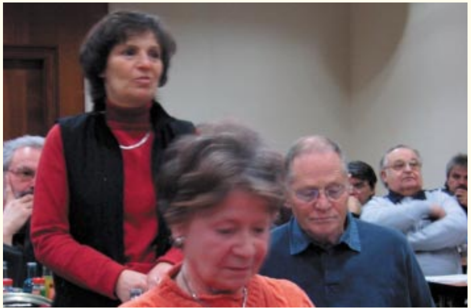
Aufmerksame Zuhörer – die Vertreter beim Neujahrstreffen.

Mitte März wurde mit den Vertretern/Ersatzvertretern über die Änderungsvorschläge beraten.