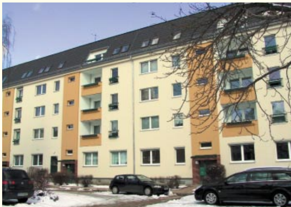
Die Hofseite der Müggelheimer Straße

neuen Gestaltung harmonisch in den Bestand der Müggelheimer Straße ein. Als besonderes Merkmal der Geschäftsstelle hebt sich die bei Dunkelheit grün hinterleuchtete Glasfassade angenehm hervor.