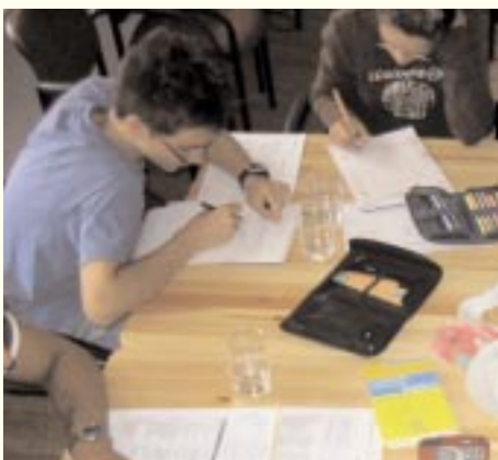
Schularbeitenbetreuung mit den „windworkers“

Die „windworkers“ werden immer aktiver in Köpenick und auch bei Amtsfeld. Für Kinder und Jugendliche, die Mitglieder der „windworkers“ sind, bietet der Verein in unserem Amtsfeldtreff folgende Veranstaltungen an: