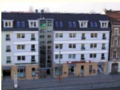
Müggelheimer Straße 17c

Das Jahr 2005 hielt in punkto Sanierung sehr anspruchsvolle Aufgaben für uns bereit.