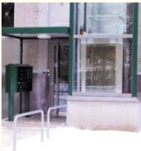
Einer der neuen Aufzüge in der Erwin-Bock-Straße von außen...

Das Haus Müggelheimer Straße 16-18 fügt sich mit seiner an den Altstadtcharakter der Nachbarhäuser angepassten