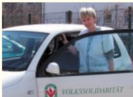
Die Mitarbeiterin der Sozialstation auf dem Weg zum Kunden

Die Sozialstation wurde im Jahr 1990 gegründet und arbeitet seit 1998 erfolgreich nach den Regeln des Qualitätsma-