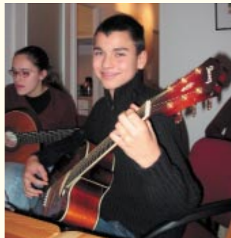
Gitarrenunterricht mit den „windworkers“

Mehr Infos gibt es im Internet unter www.windworkers.de